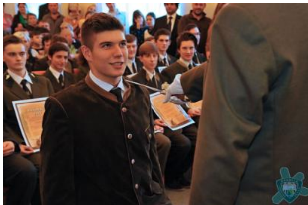
Pasovaný žák z 1. A