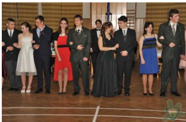
Žáci třetích ročníků při závěrečných tanečních