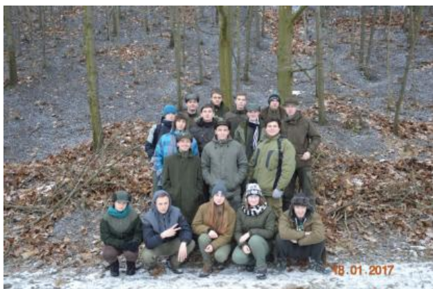
Žáci 3. C na haldě