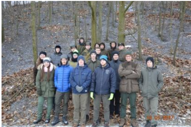
Žáci 3. A na haldě