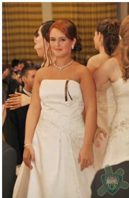
Žakyně čtvrtých ročníků při slavnostní polonéze